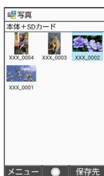
写真 / 画像 → 挿入する画像を選択 → ○